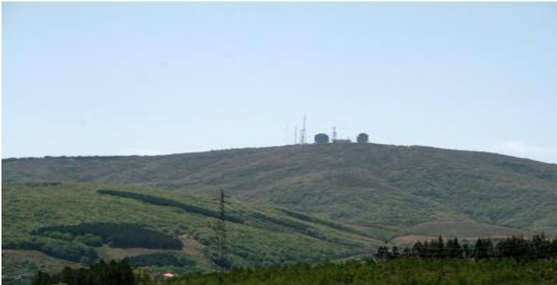
Figura 2 - Paisagem da Serra de Nogueira.